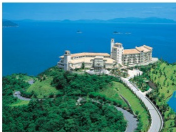
グランドエクシブ鳴門