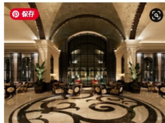
エクシブ有馬離宮